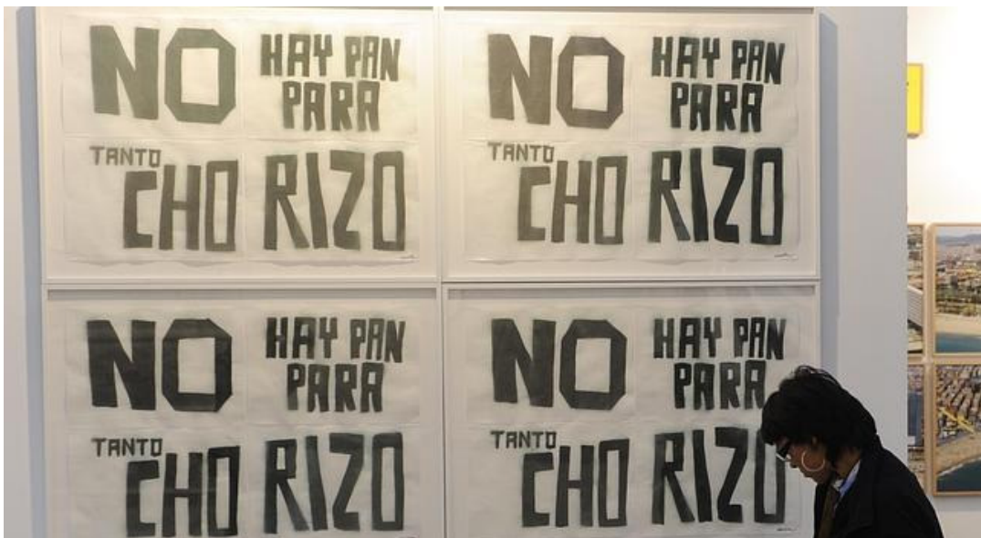
Obra de Miralda en Arco 2012

Comparte el galardón, que se ha fallado hoy, con la galería bilbaína CarrerasMugica y la fundación Sorigué de Lérida