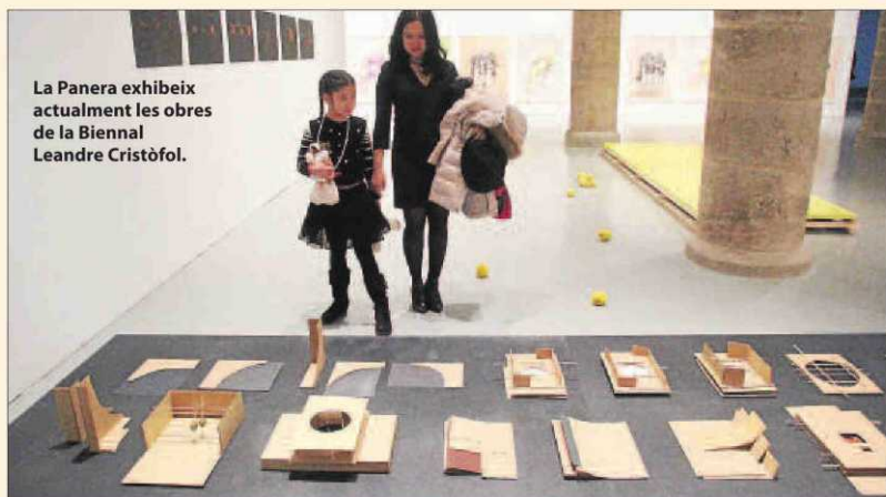
La Panera exhibeix actualment les obres de la Biennial Leandre Cristòfol.

Crec que sí perquè cada any tenim entre 16.000 i 17.000 visitants, i la majoria són de la ciutat. Lleida no és un lloc tan turístic com ho pugui ser Barcelona, on per exemple el 60 per cent dels visitants del Macba són turistes. Això vol dir que són els ciutadans de Lleida els que utilitzen el Centre d'Art la Panera.