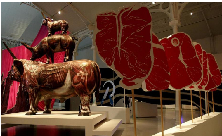
Parte de la exposición de 2010 de Miralda, en el Palacio de Velázquez, en Madrid.

intervención en el restaurante La Internacional, inaugurado hace 30 años en Nueva York, donde empezó a investigar sobre las relaciones culturales entre arte y comida.