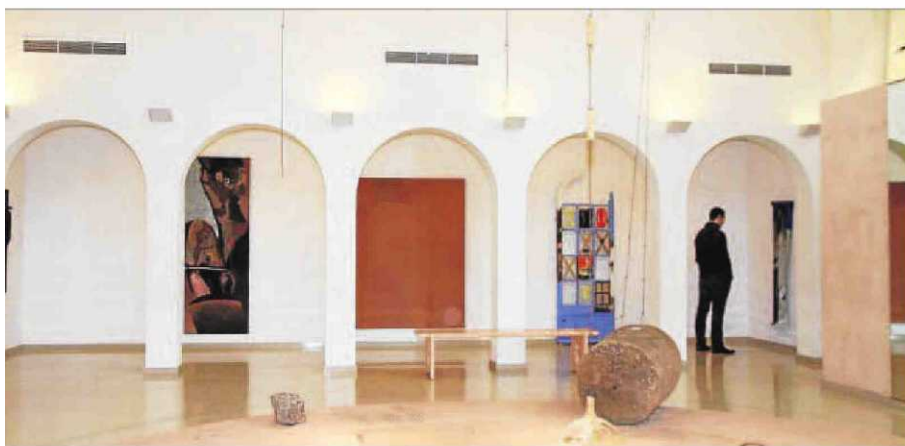
Vista d'una de les sales d'exposició de l'Espai Guinovart d'Agramunt.

especial per a nosaltres: era l'arribada de la primavera, el dia de l'eclipsi i Guino hauria complert 88 anys.