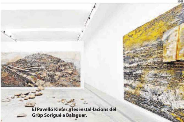
El Pavelló Kiefer a les instal·lacions del Grup Sorigué a Balaguer.

forma gairebé natural es van formant conjunts d'obres de determinats autors com Kiefer, Kentridge, Antonio López o Bill Viola que provoquen els diàlegs creuats.