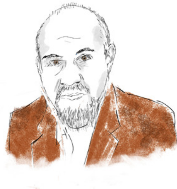
Carlos León. Ilustración: Luis Parejo

EL CULTURAL | 08/04/2016 | Edición impresa