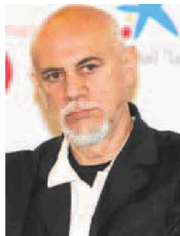
Carlos León.

En la justificación del premio a Carlos León (Ceuta, 1946) el jurado afirmó que «desde su primera exposición en 1976, siempre ha estado comprometido con la abstracción, manteniendo una incesante investigación sobre los soportes y la pintura, explorando sus posibilidades