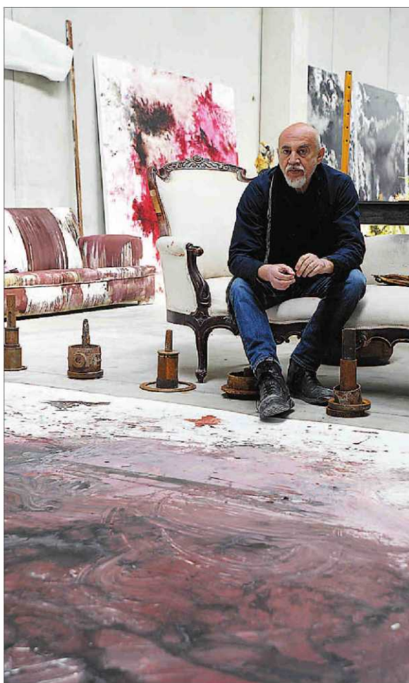
El artista plástico de origen ceutí cumple 48 años de trayectoria.

"El verdadero hedonista es el que quiere el goce para sí y para los demás, quiere una sociedad gozosa, donde no haya abuso ni la fealdad que supone toda ostentación de tipo totalitario", razona el artista.