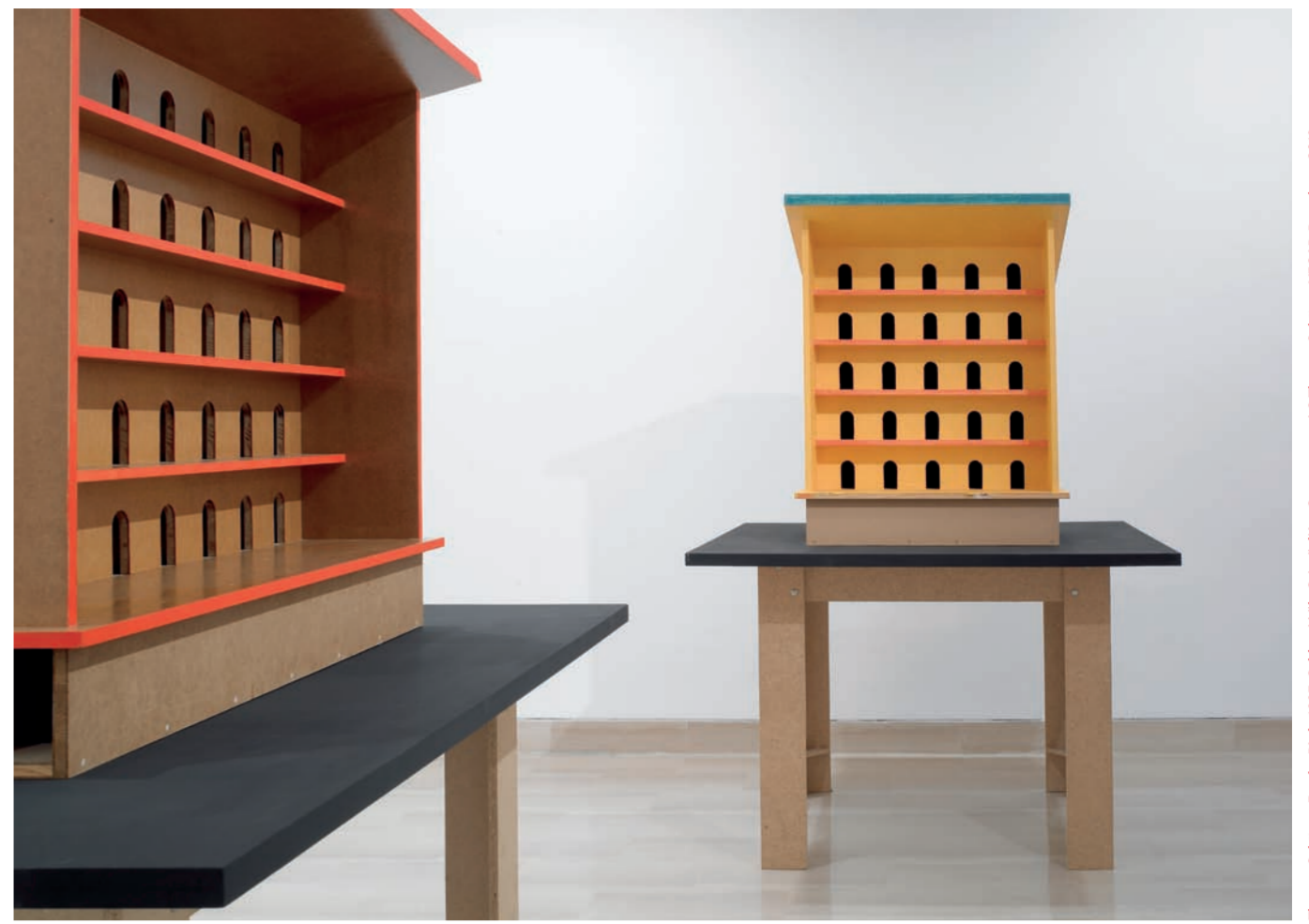
Thomas Schütte, for the birds , 1997. Col·lecció "la Caixa" d'Art Contemporani © Thomas Schütte, VEGAP, Barcelona, 2018