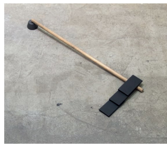
Christian Garcia Bello, Tres escalones , 2015.