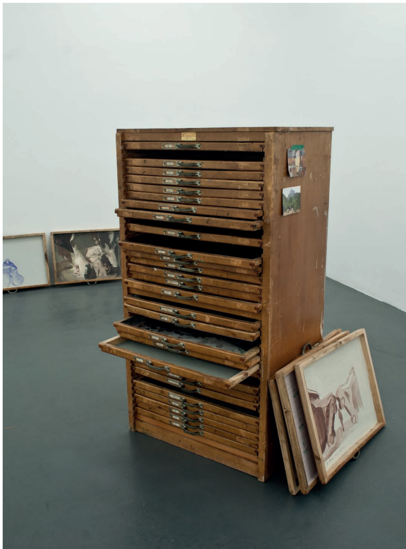
Pere Llobera, July , 2014. Col·lecció "la Caixa" d'Art Contemporani © Josep Llobera Vives (imatges de detall) i Paloma G. Dotor (imatge general de l'obra)

Del 31 de gener al 20 de maig de 2018 Del 31 de enero al 20 de mayo de 2018 From 31 January until 20 May 2018