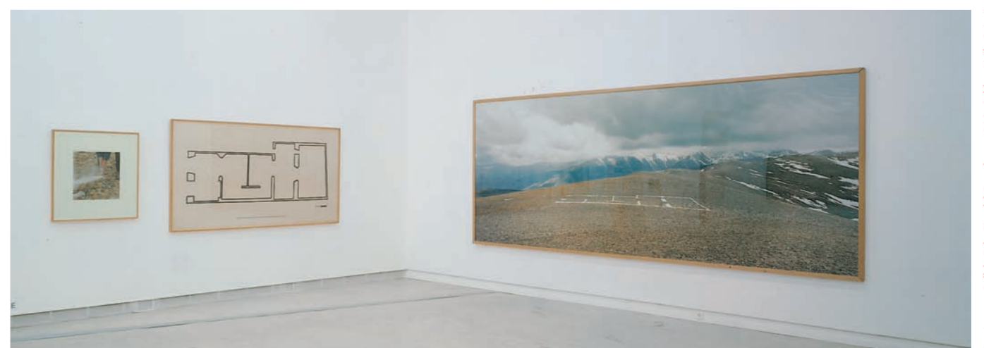
Perejaume, Cim de Pay - Cim del Cosalobas , 1990. Col·lecció "la Caixa" d'Art Contemporani © Perejaume, VEGAP, Barcelona, 2018