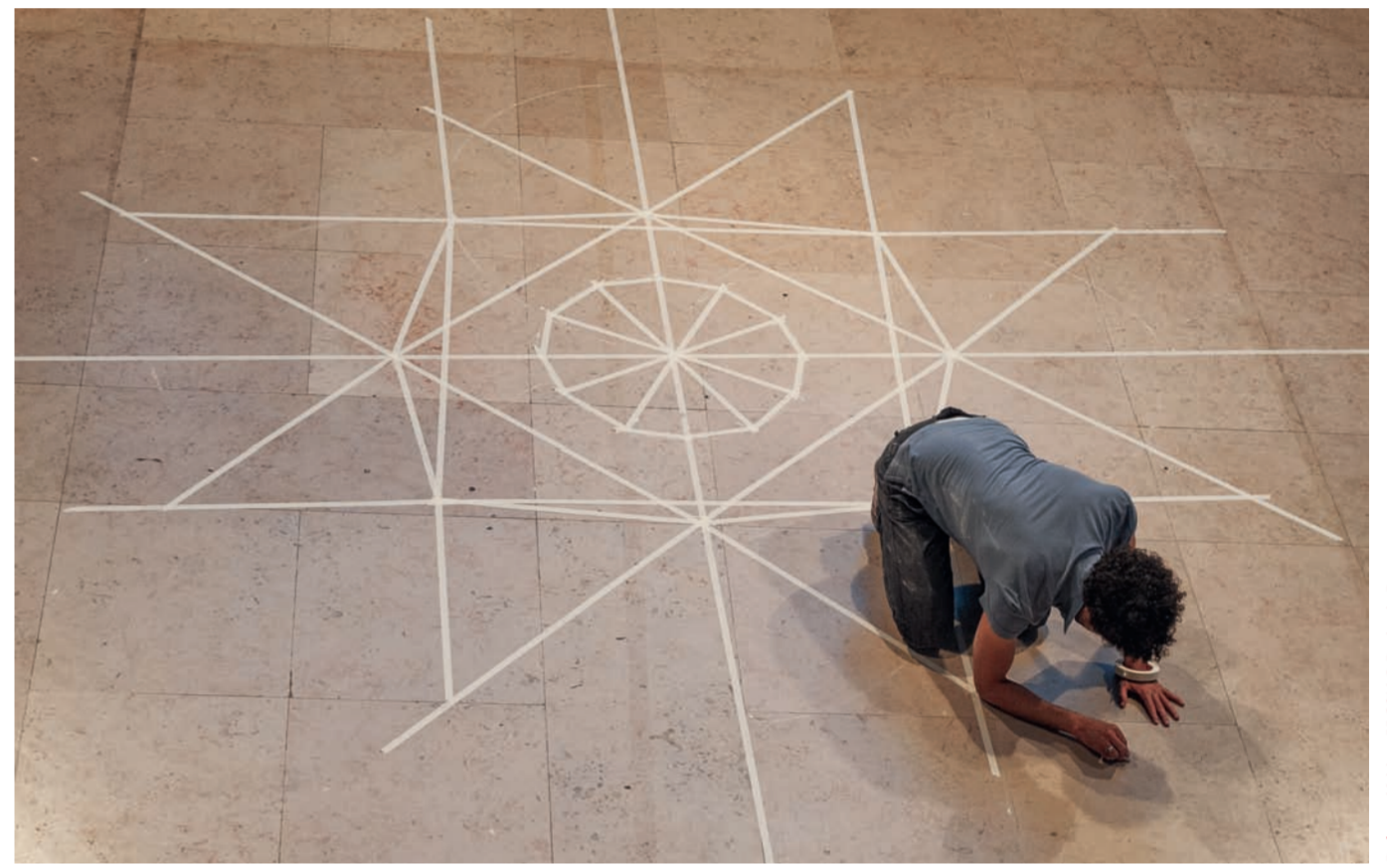
Rafael Sanjaume, 55 , 2014