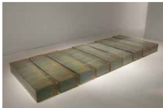
Rachel Whiteread, Untitled (Resin Corridor) , 1995. Colección "la Caixa" de Arte Contemporáneo. © Rachel Whiteread.