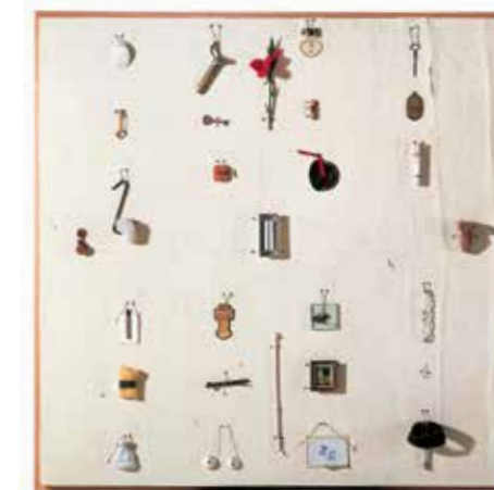
Carmen Calvo, Tal cual , 1989. Colección "la Caixa" de Arte Contemporáneo. © Carmen Calvo, VEGAP, Barcelona, 2015.

La exposición se completa con la instalación de Joseph Beuys Hinter dem Knochen wird gezählt - SCHMERZRAUM , que se encuentra en exposición permanente en el edificio de CaixaForum. Se trata de una habitación con las paredes recubiertas de plomo, precisamente el metal que absorbe las radiaciones y la luz, con lo cual se diría que la estancia es capaz de conservar la memoria de las energías que se generan dentro de ella.