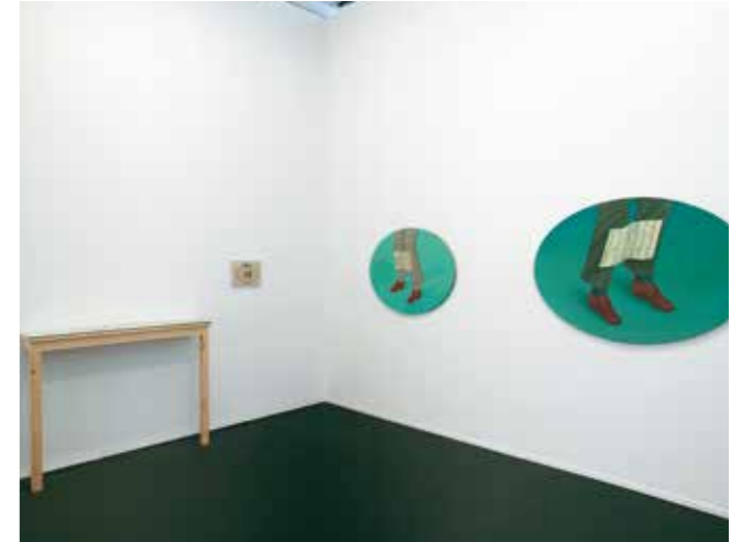
Francis Alÿs. Sin título (de la serie El mentiroso, la copia del mentiroso ), 1995. Instalación.