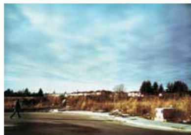
Jeff Wall. Escena de caza , 1994. Transparencia cibachrome , marco de aluminio y luz fluorescente.

Grupos de un máximo de 25 personas Es necesaria la inscripción previa en el tel. 976 768 201 Precio por grupo: 60 € Los grupos con guía propio también deberán reservar día y hora.