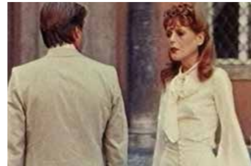
João Onofre. Sin título ( Martha ), 1998. Videoproyección (fragmento de Martha , de Rainer Werner Fassbinder, 1974).

Las obras presentan una gran variedad de narrativas visuales y manifiestan un deslizamiento hacia lo literario, lo teatral y lo cinematográfico. Sus estrategias creativas transitan entre la imagen y la escritura, aunque la puesta en escena está supeditada al proceso de posproducción, realizado en la mayoría de los casos mediante tecnologías digitales.