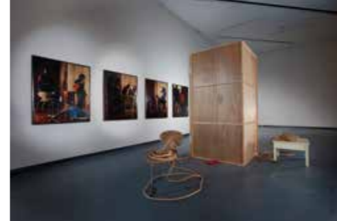
Txomin Badiola. Quién, cuándo o cómo ( desconocidos ), 1995. Instalación © Txomin Badiola, VEGAP, 2014.

Esta exposición reúne un conjunto de obras de la Colección "la Caixa" de arte contemporáneo cuyos artistas se inspiran en distintas formas de representación y trabajan con un mestizaje de técnicas visuales que les permite crear sorprendentes modos de contar historias, desde la pura ficción hasta el documental. El espectro de posibilidades es amplio, e incluye tanto imágenes narrativas simples como complejas exploraciones de construcción de relatos.