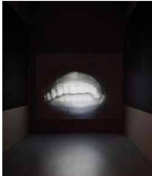
Samuel Beckett. Not I ( No yo ), 1972. Vídeo monocanal. Colección MACBA. Consorcio Macba.

La exposición Narrativas en la imagen nos traslada al contexto del arte contemporáneo, que ha encontrado en la capacidad narrativa que proporcionan soportes visuales como la fotografía, el vídeo y las tecnologías digitales un fértil ámbito creativo para producir nuevos relatos y, al mismo tiempo, una vía de exploración de los códigos narrativos que moldean el conocimiento de nuestro mundo.