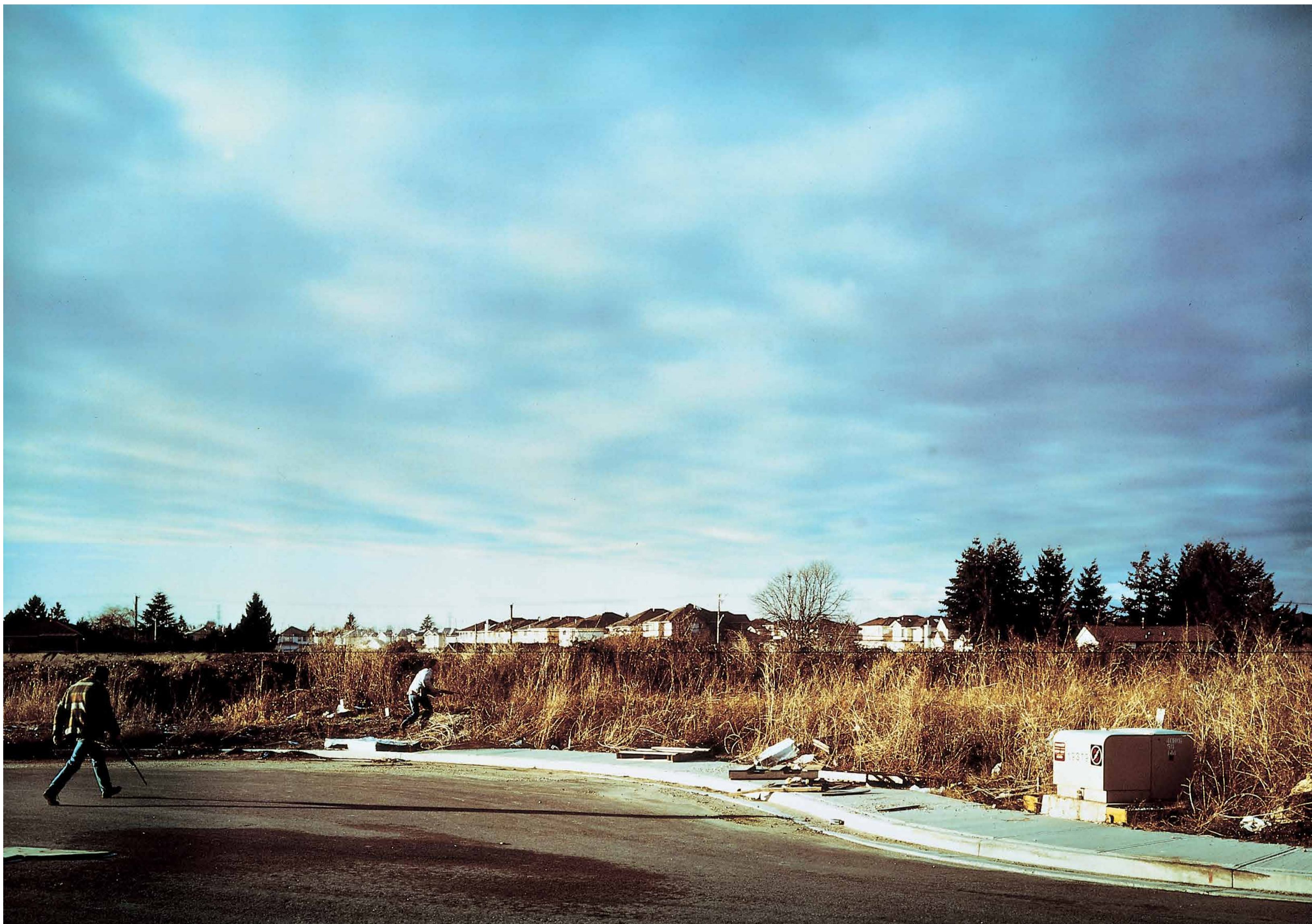
Jeff Wall A Hunting Scene [Escena de caza] 1994 Colección "la Caixa" de Arte Contemporáneo